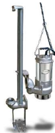
EL CODO DE DESPLAZAMIENTO RDSV2-I SE VENDE POR SEPARADO