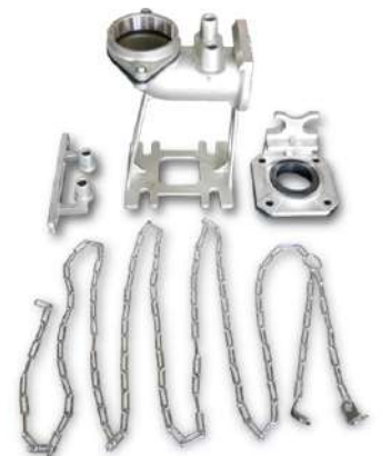
EL CODO DE DESPLAZAMIENTO RDSV3-I SE VENDE POR SEPARADO