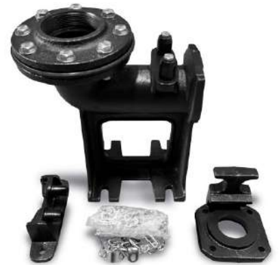
EL CODO DE DESPLAZAMIENTO RDSV3 SE VENDE POR SEPARADO